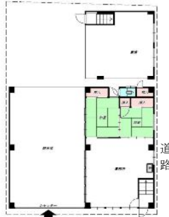
●1階配置図・平面図